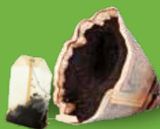
Marc de café, sachets de thé