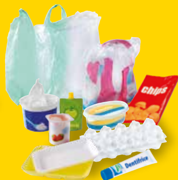
Tous les autres emballages en plastique