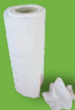
Serviettes en papier Essuie-tout