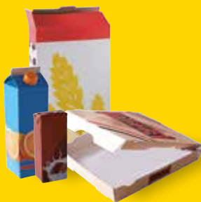
Emballages et briques en carton