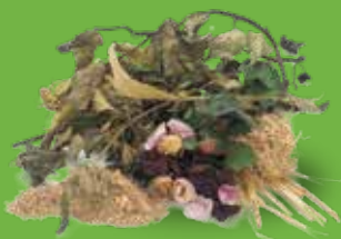
Brindilles, fleurs fanées, feuilles mortes, broyat