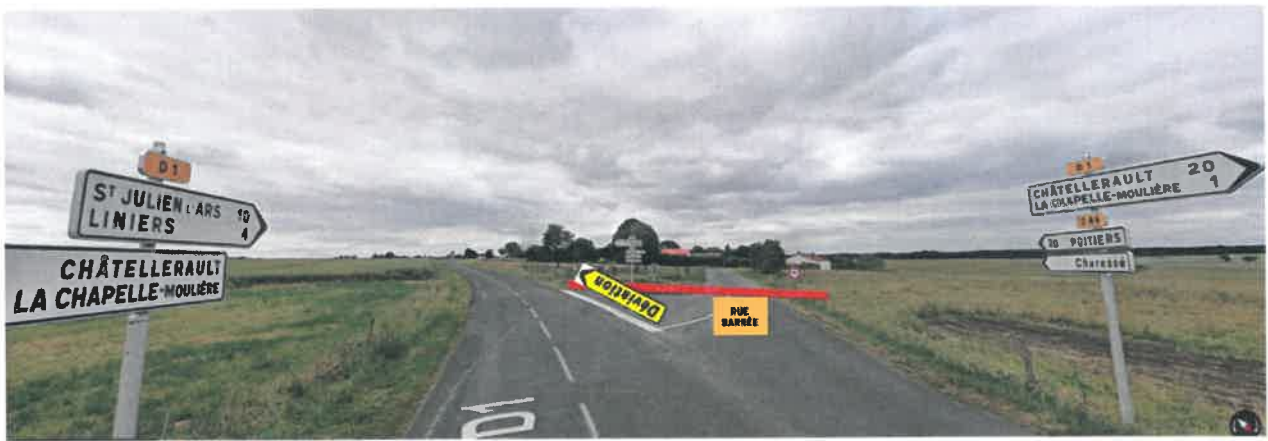
INTERSECTION D1 / D86